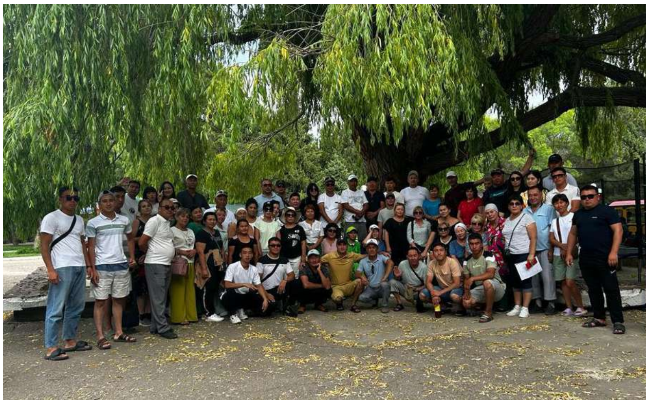
Общее фото на память работников ТОО «Жамбылские электрические сети» на территории пансионата «Ала-ТОО» (озеро Иссык - Куль), июль 2023г.