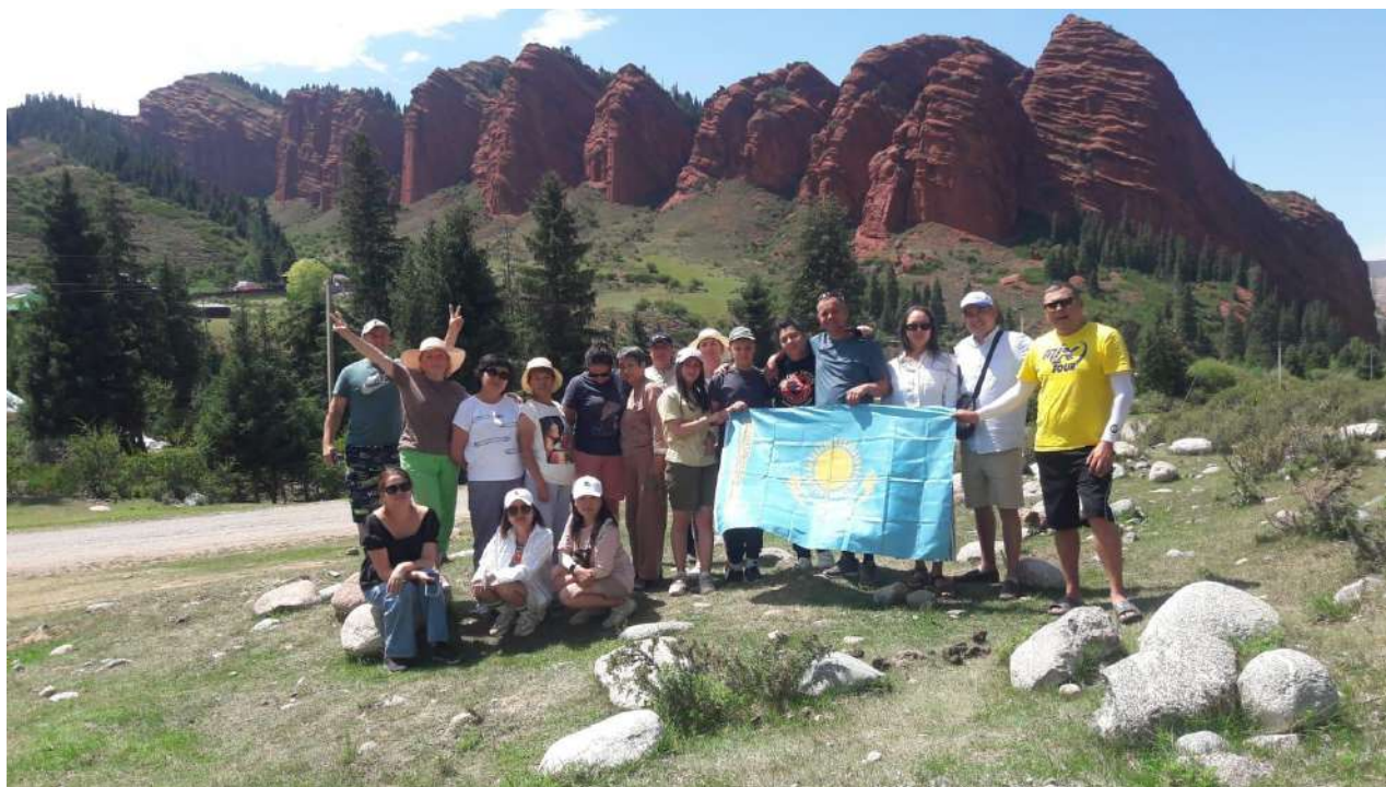
Работники ТОО «Жамбылские электрические сети» на экскурсии в горах Киргизии, Иссык-Куль, июль 2023г.