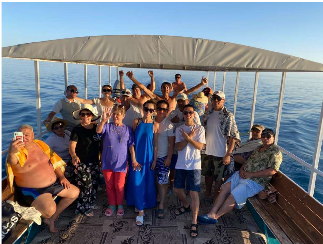
Прогулка работников ТОО «Жамбылские электрические сети» на теплоходе по озеру Иссык-Куль, июль 2023г.